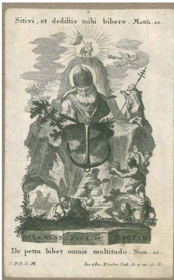
San Clemente

La reliquia consiste in una parte di osso, di pochi centimetri, ben evidente la porosità, posta dentro una scatolina, munita di vetro, circondata da una bellissima filigrana in argento e perline, il tut-